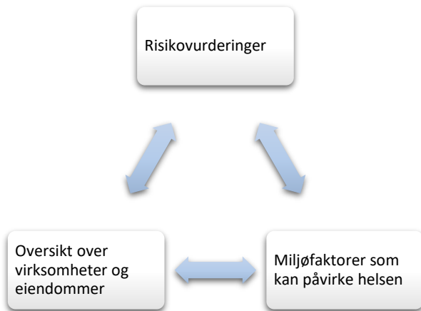
Figur 1 Prioriterte tilsynsområder ut fra risiko

Miljørettet helseverntilsyn skal være basert på risikovurderinger av de miljøfaktorer i omgivelsene som kan virke negativt inn på helsen. Risikovurderingen danner grunnlaget for utvelgelse av tilsynsområder.