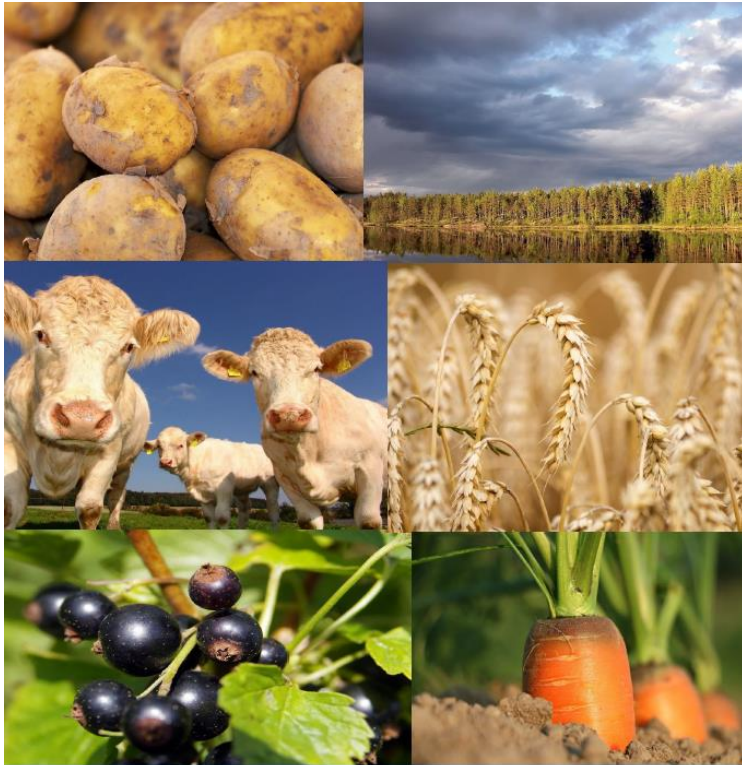
Temaplan landbruk & beite