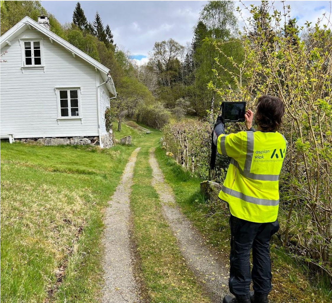
Asplan Viak i felt og registrerer i en annen kommune