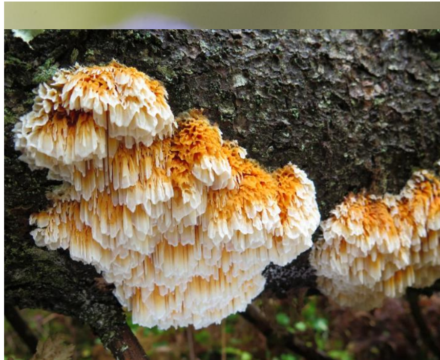
Storsporet flammekjuka.

Norges største populasjon av storsporet flammekjuka (sterkt truet) er ved Katnosa i Ringerike.