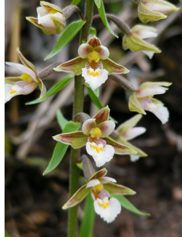
Myrflangre (sterkt truet). Foto: Mika Tomta, Ultvedtjern. Lisens BY NC 4.0.