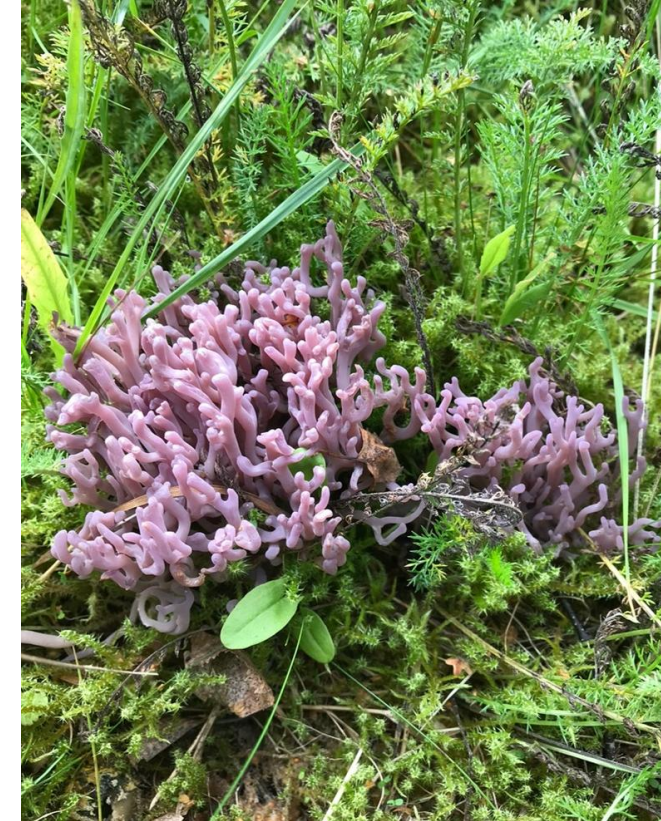
Fiolet greinkøllesopp (sårbar). Gunvor Bollingmo, Hvalsmoen. Lisens CC BY 4.0.