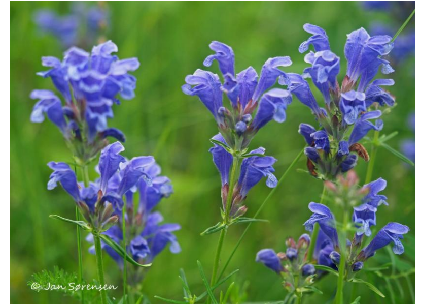
Dragehode. Foto: Jan Sørensen, Nordby i Ringerike. Lisens CC BY 4.0