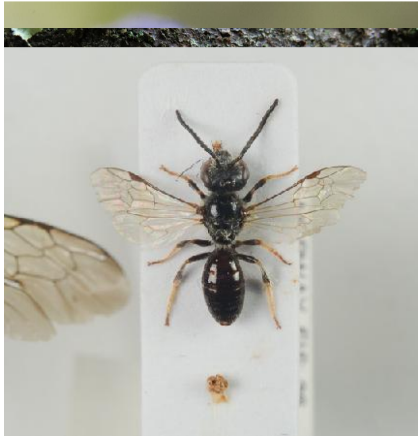
Reliktjordbie. Foto: Frode Ødegaard, Busund. Lisens CC BY 3.0.

Reliktjordbie (kritisk truet): I Norge kun funnet ved Busund i Ringerike. En av Skandinavias sjeldneste bier.