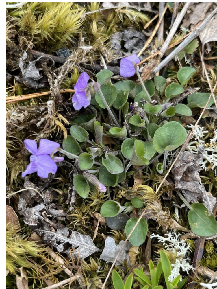
Sandfiol (sårbar). Foto: Gunvor Bollingmo, Åsa. Lisens CC BY 4.0