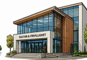
Frivillige og ideelle aktører